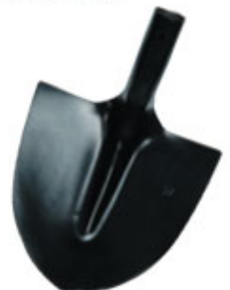
Pelle col de cygne