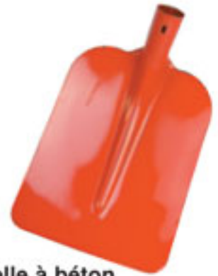
Pelle à béton